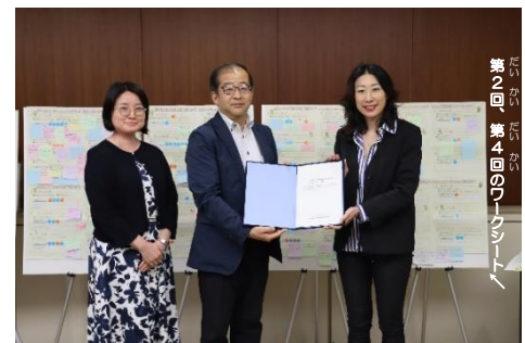
「答申」を提出するとき(7/5)の写真