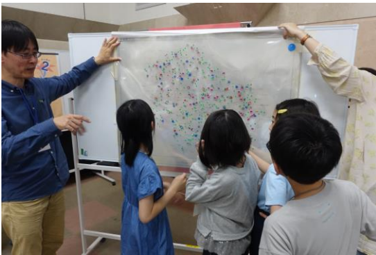
マップを重ねて見てみよう～

ミッション3 みんなが作ったマップを重ねてみよう！ 班ごとに作ったそれぞれの居場所のマップを重ねると、何が見えてくるかな？ 言いたいことはあるかな？ 話し合ってみよう！