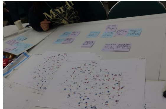
自分の気持ちや思いを共有したよ！