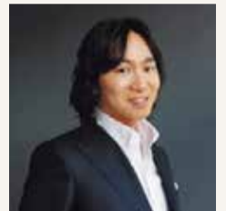
▲阪田知樹