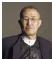
▲山下洋輔