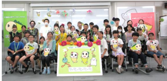
第2回の参加者は31人!