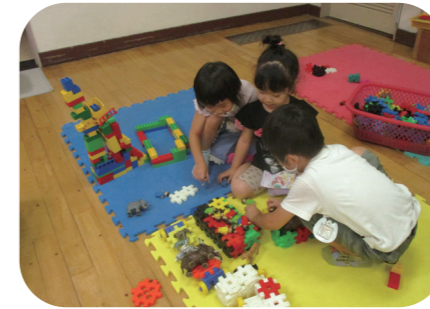
異年齢で遊ぶ夕保育