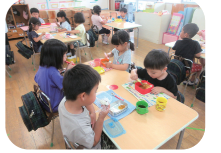
みんなで食べるおいしい昼食