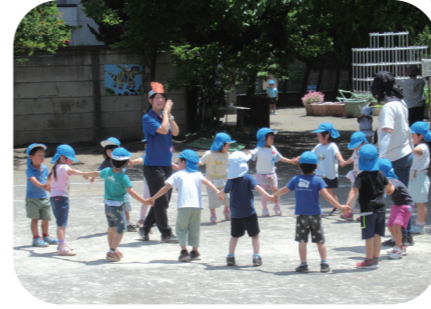
先生や学級のみんで遊ぶ