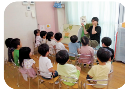
大好きな先生と絵本読み聞かせ