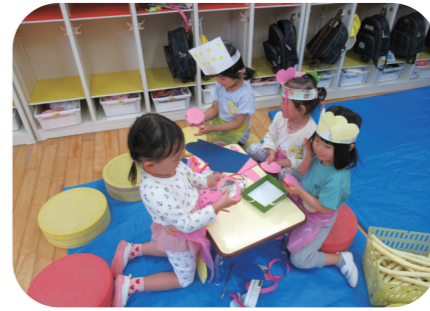
自分で選んだ遊びを楽しむ