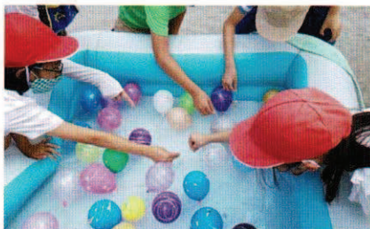
松庵小学校PTA 「花火みたいな!? ヨーヨーすくい大会!」