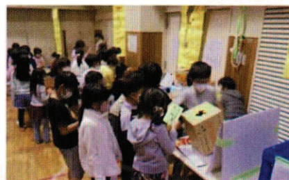
西荻南児童館 「ザ☆えんにち」