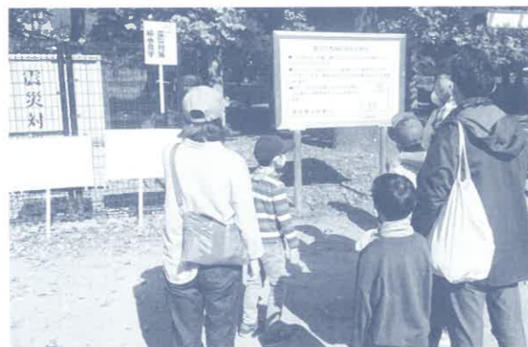
②震災対策給水施設見学