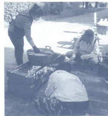
⑤防災かまど (クッキングデモンストレーション)