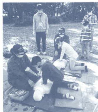
③救護に関する体験