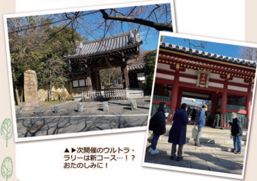
▶次開催のウルトラ・ラリーは新コース...!? おたのしみに!

今回は高円寺南口の氷川神社(気象神社)、高円寺(高円寺の地名の由来となったお寺)などをラリーコースの実地として見て回りました。これから時間をかけて、委員・PTA・学校・児童館・地域で意見を出し合って新しい形の野外活動を模索していきます。ご協力よろしくお願いたします。