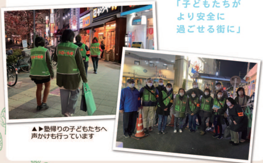
▶▶塾帰りの子どもたちへ声かけも行っています