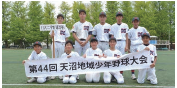
中学生の部 準優勝 日大二中 B