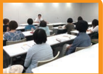
東京都青少年の健全な育成に関する条例 検索

7月17日(水)荻窪警察署生活安全課スクールサポーターさんのお話を伺いました。 杉並区はどの地域も落ち着いているようですが、補導件数は少なくないとのこと。東京都の条例で深夜23時以降の外出制限、ゲームセンターは保護者同伴でなければ18時までといったことも決められていますが、条例の内容を大人がよく知らないという背景もあるようです。 また「気をつけて」と送り出しますが、事故の心配なのか、時間帯や行き先に関してなのか、子ども達が危険をイメージできるような具体的な声かけが効果的とのアドバイスもいただきました。 (河野 知恵子)