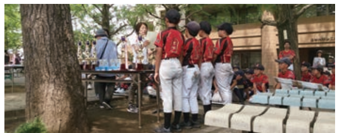
東京防犯協会連合会からトロフィーや飲み物などを、山崎製パン株式会社からパンをご提供いただきました。ありがとうございました。

今年は、天沼小学校の教員お二人がボランティア参加、審判へ冷たいお水とおしぼりを届けてくださいました。選手の応援や中学生ボランティアを気にかけてくださるなど、楽しそうなお姿が印象的でした。ありがとうございました。