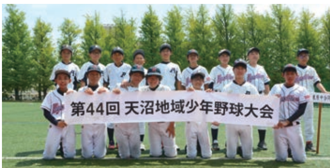
天沼中・東原中合同チーム