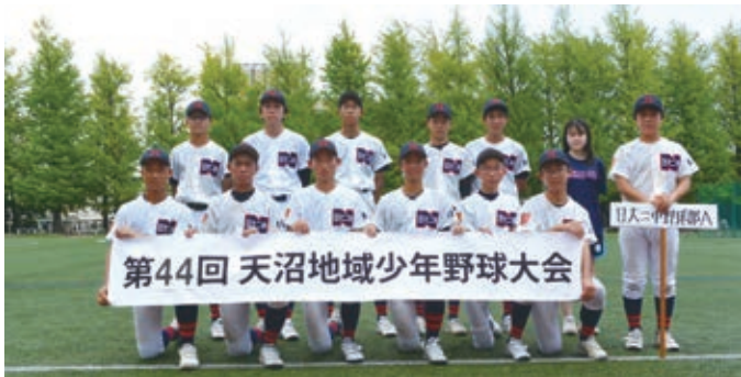
中学生の部 優勝 日大二中 A