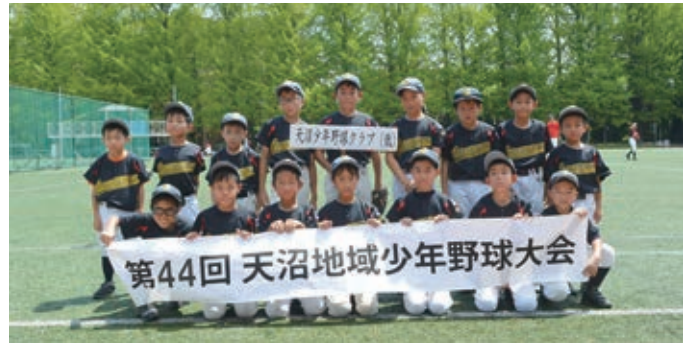
小学生の部 低学年 準優勝 天沼少年野球クラブ