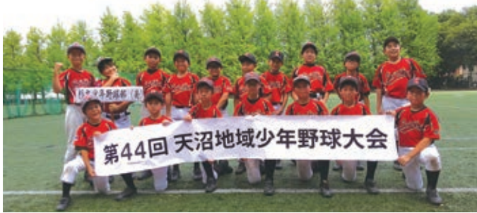
小学生の部 高学年 優勝 杉九少年野球部