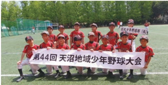
小学生の部 低学年 優勝 杉九少年野球部