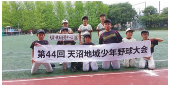
小学生の部 高学年 準優勝 天沼・桃五合同チーム