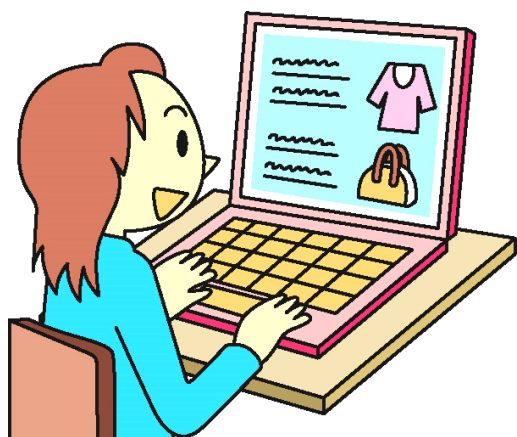
「消費者庁イラスト集より」

特に近年は、日本の消費者が、冬物衣料・履物（ダウンジャケット・ブーツ等）を購入する時期にあわせて、詐欺・模倣品サイトが登場してくるケースが多くなっており、トラブルが冬季（11月～1月）に集中して発生する傾向があります。