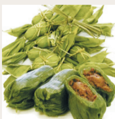
小千谷市の笹団子▶