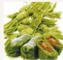
小千谷市の笹団子▶