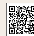
人権に関して特に力を入れるべき取り組み

人権意識の向上と区民一人一人の人権が尊重される社会の実現を目指して、区内在住で18歳以上の方の中から無作為抽出した3000名に人権に関する意識調査を実施しました。 調査では、人権に関して特に力を入れるべき取り組みを尋ねたところ、約3割の方から「人権教育の充実」「人権相談・支援体制の充実」の回答がありました。 調査結果は、今後の人権啓発を進めていくための資料として活用していきます。詳細は、区ホームページ(右2次元コード)をご覧ください。