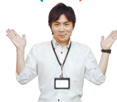
公民連携担当課長