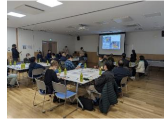
防災についての 意見交換会