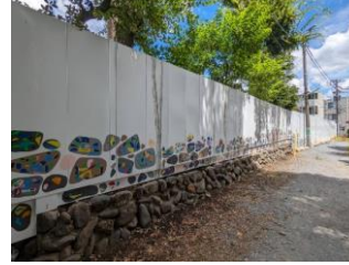
仮囲いアートワーク 「木と石ころ」