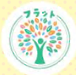
▲ふれあいライブ出演団体 (左から: ヴィレッジセブン、日本ろう者太鼓同好会、フラット)