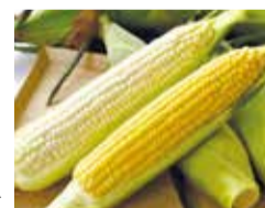
北海道名寄市のトウモロコシ▶