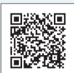
▲杉並区防災マップ