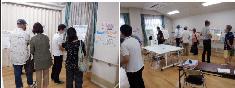
※前回（令和4年8月）の様子

※お車での来場はご遠慮ください。 ※両日とも同じ内容です。 ※お子さま連れでご来場いただけますが、お預かりする体制がございませんので、あらかじめご了承ください。