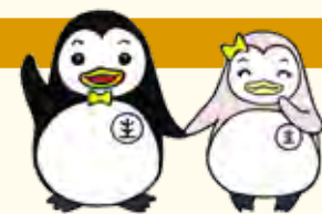
▲更生保護のマスコットキャラクター 更生ペンギンのホゴちゃん、サラちゃん