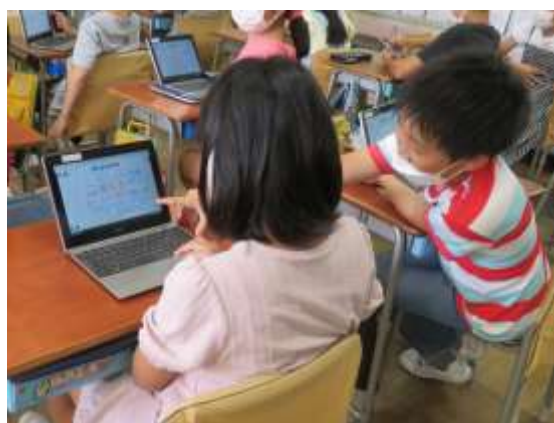
授業でタブレットを使う様子