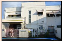
▲高井戸東保育園・ゆうゆう高井戸東館