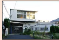
▲旧保育室浜田山東