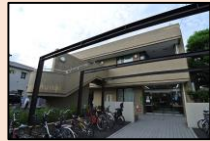
▲浜田山会館・ケア24浜田山