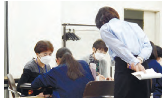
▲中高生のための無料学習・受験サポート事業