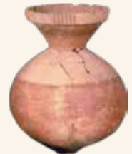
▲大宮遺跡出土土器