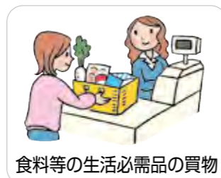
食料等の生活必需品の買物