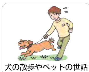
犬の散歩やペットの世話