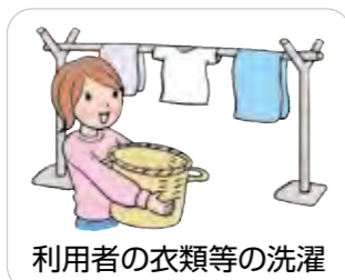
利用者の衣類等の洗濯