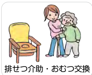
排せつ介助・おむつ交換

入浴や排せつ、食事の介助など利用者の身体に直接触れる介助等で、本人が行うのが困難な場合