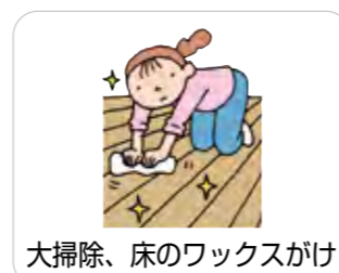
大掃除、床のワックスかけ