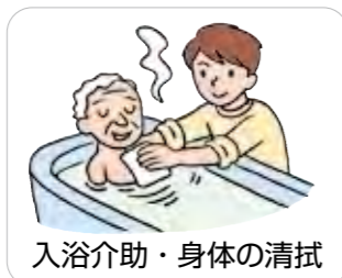
入浴介助・身体の清拭