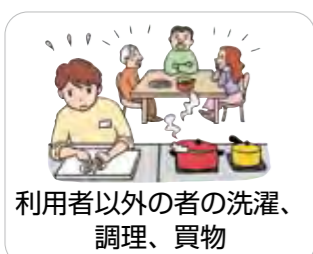
利用者以外の者の洗濯、調理、買物

「直接本人の援助」にならない行為や、「日常生活の援助」に該当しない行為、「日常的な家事の範囲」を超える行為は、介護保険の対象になりません。