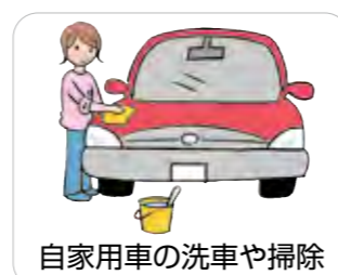
自家用車の洗車や掃除