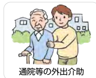
通院等の外出介助