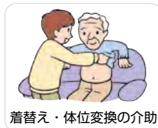
着替え・体位変換の介助