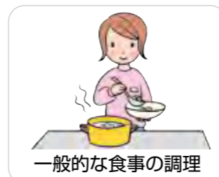
一般的な食事の調理

※介護保険の訪問介護は、ケアマネジャーが利用者の身体状況や家族の状況等を勘案して居宅サービス計画に位置づける必要があります。