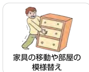
家具の移動や部屋の模様替え