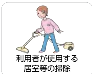
利用者が使用する居室等の掃除

掃除、洗濯、買物、調理などの家事で、利用者が行うことが困難な場合(同居の家族等がいる場合は、当該家族が障害、疾病等の理由でできない場合)