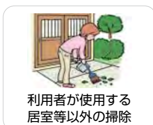
利用者が使用する居室等以外の掃除