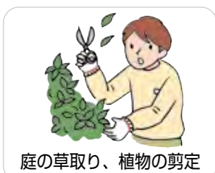
庭の草取り、植物の剪定