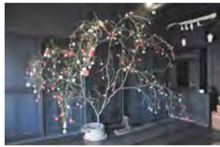
…… いずれも …… 場同郷土博物館(〒168-0061大宮)

時6年1月8日(祝)午前10時～正午 対区内在住・在学の小学生とその保護者 定10組20名(抽選) 申往復はがき(記入例。保護者1名につき子ども2名まで連記可)で、同博物館。または東京共同電子申請・届出サービス(区ホームページ同催し案内にリンクあり)から申し込み/申込期限=12月19日