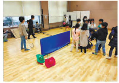
▲ゆるゆるma~ma みんなのいばしょ 東原Pタイム