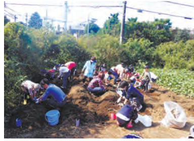
▲上井草結いの会 親子で農業体験