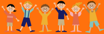
がいこくせき こ 外国籍の子ども