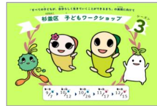
れいわ ねん がつ かいさいちゅう すぎなみく こ : 令(れい)和(わ)6年(ねん)9月(がつ)～開(かい)催(さい)中(ちゅう) | 杉(すぎ)並(なみ)区(く)子(こ)ども(も)ワ(わ)ーク(く)シ(し)ョ(ョ)ッ(ッ)プ(プ)シ(し)ーズ(ず)ン(ん)3

く では「子(こ)ども(も)の権(けん)利(り)を(を)守(まも)るた(た)めに必(ひつ)要(よう)なこ(こ)と」な(な)どに(に)つ(つ)いて考(かん)え(え)るワ(わ)ーク(く)シ(し)ョ(ョ)ッ(ッ)プ(プ)を(を)開(かい)催(さい)し、大(お)人(ひと)だ(だ)け(け)で(で)な(な)く子(こ)ども(も)か(か)ら(ら)も意(い)見(けん)を(を)聴(き)く取(と)り組(く)み(み)を(を)行(おこな)っ(っ)てい(い)ま(ま)す(す)。