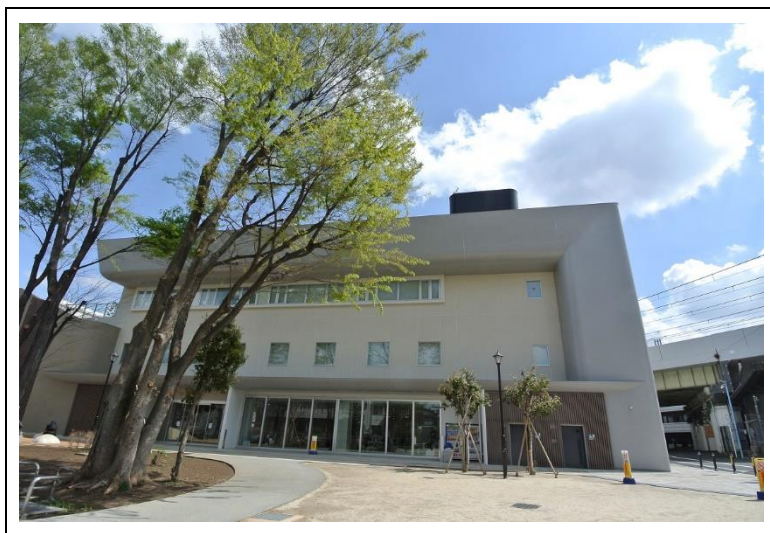
移転改築後の阿佐谷地域区民センター等複合施設

廃止後の阿佐谷けやき公園プール用地には、阿佐谷地域区民センター及び阿佐谷児童館を移転改築し、令和4年4月に開設しました。移転改築前の阿佐谷地域区民センターは建物を賃借しての運営であり、施設が老朽化している状況の中で、移転改築を行わなければ、地域の集会等活動の場が失われる状況にありました。昭和56年から約35年に渡り利用されていた阿佐谷けやき公園プールは廃止しましたが、阿佐谷地域区民センター及び阿佐谷児童館を移転改築することで、継続的・恒久的な地域の集会活動、趣味や文化の活動等の場や、子どもの居場所を確保することに加え、屋上立体公園部分も含め阿佐谷けやき公園を整備することで、地域の憩いの場を確保するなど、区民福祉の向上に大きく寄与する取組になったものと総括しています。