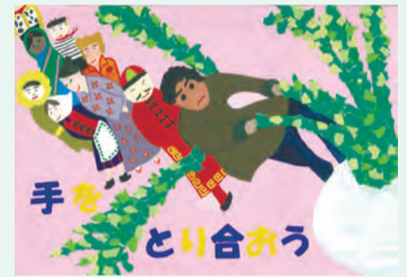
▲4年度の入賞作品の一部