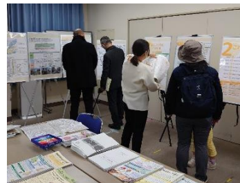
方南一丁目地区防災まちづくりに関するオープンハウス開催(R4 年 12 月)