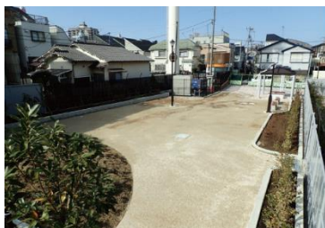
馬橋ほんむら公園(H30 年度開園)