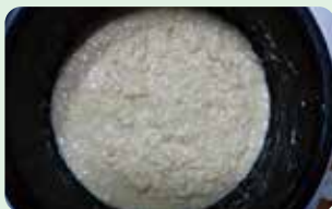
炊飯器で発酵させる