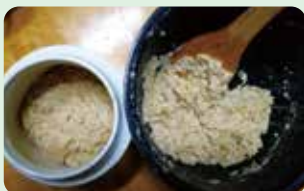
清潔な容器に移す