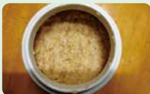
24時間熟成させた白みそ