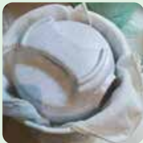
重石を乗せて保存する↑