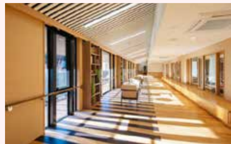
図 高齢者施策課施設整備推進担当