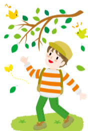
図 4月13日(木)午前10時～正午(荒天中止) 場 集合=井の頭恩賜公園野外ステージ前(武蔵野市御殿山1-18-31) 師 樹木医・岩谷美苗 対 区内在住・在勤・在学の方(小学生以下は保護者同伴) 定 20名(抽選) 費 400円(保険料を含む) 申 NPO法人すぎなみ環境ネットワークホームページから、3月12日までに申し込み 他 動きやすい服装・運動靴で、雨具持参