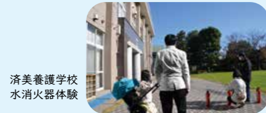
済美養護学校 水消火器体験

担当する委員会が組織できず、実質的なスタートは8月末。関係機関とのやりとりや書類作成の負担も大きく、事務局担当の私、10月末時点ですでに青色吐息でした。結果、チラシ配布や掲示等、直前の告知がおざなりになり、当日の参加者数は見込みの5分の1、スタッフの人数とほぼ同数、トホホ…。お天気にはとても恵まれたのですが…。とはいえ、参加者からは「一般論ではなく自分の地域のリアルな知識が得られた」「AEDや救急法の体験が良かった」「近所にいろんな設備があることがわかった」と上々の反応。防災イベントは求められているのかも?!と手応えを感じました。また育成委員会の催しへの参加は「今回初」という親子が多かったのも収穫でした。ご協力いただいた杉並消防署堀ノ内出張所、及び消防団の皆さん、区の防災課、土木事務所の方々、大変お世話になりました！なにより当日手伝いを引き受けていただいた大宮中地教連、堀ノ内南町会、堀ノ内一・二丁目町会の皆さん！皆さんのご協力なしには開催できませんでした。この場を借りてお礼申し上げます。m(_ _)m (事務局担当：日吉 朋子)