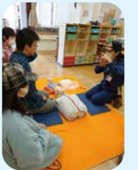
AEDデモンストレーション