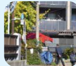
熊野橋児童遊園 土のう置き場