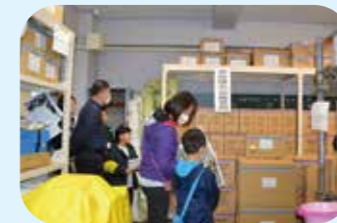
大宮中学校 防災倉庫見学