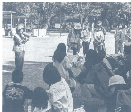
本部 救護 スタート & ゴール地点

今回は一斉に集まることができ、全員で開会式を行い、時間いっぱい使って12のコーナーを空いている所から順に回りました。高校生、中学生のゲームコーナーもあり盛り上がりました。親子で楽しみながら防災体験ができ、全部回って最後に参加賞を大事に持ち帰りました。帰宅してからも話題になると嬉しいですね。参加賞は、善福寺川緑地サービスセンター・防災課・杉並警察・山崎パンからご協力いただきました。