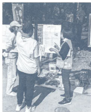
②防災用品や応急給水施設の知識