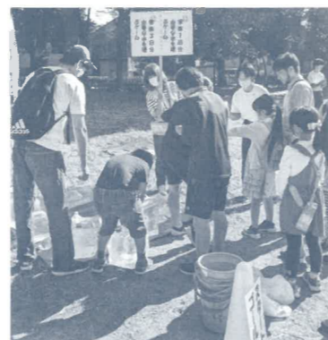
⑫1日に必要な水を運ぶゲーム