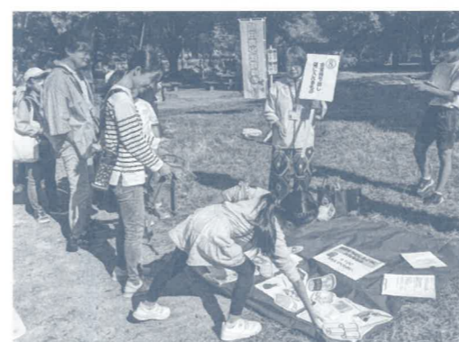
⑧非常持ち出し袋に入れるもの