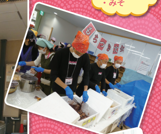
同時開催 桃二小 おやじの会のもちつき大会