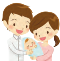
…… いずれも ……

時3月26日(日)午前10時~11時40分・午後1時30分~3時10分 場区役所分庁舎(成田東4-36-13) 内妊娠中の過ごし方、出産の流れ、母乳・産後の話ほか 区内在住の初産で平日母親学級への参加が困難な方 定各22名