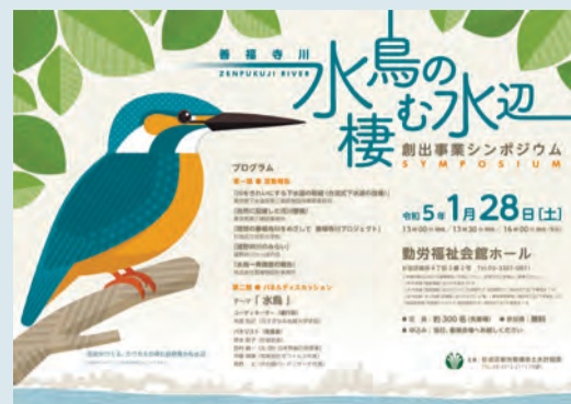
▲ポスター制作=女子美術大学

日程 1月28日(土) 午後1時30分～4時 場所 勤労福祉会館 (桃井4-3-2)