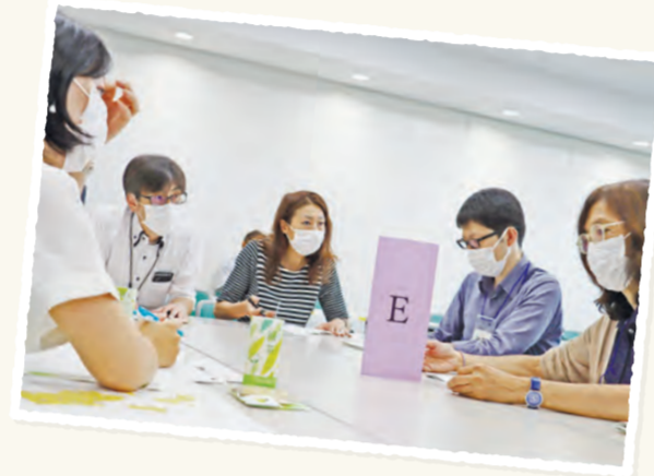
区民の皆さんと区長が直接意見を交換