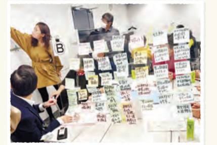
都市整備部都市計画道路担当 ▲さとことブレスト

都市計画道路事業に着手している西荻・高円寺地域では、参加者の年齢や立場を実施回ごとに変え、区民と区長の対話集会を開催し、さまざまなご意見をお聴きしています。また、まちづくりや道路整備に関するアンケートも実施しています。今後、アンケートの結果やこれまでの対話集会の経過を公表する場として、シンポジウムを予定しています。