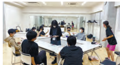
▲どんまい福祉工房 中学生の居場所「寺小屋学ぼう」