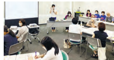
▲みかんぐみ 医療的ケア児者・重度障害児者のためのワークショップ