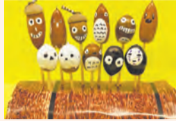
▲③どんぐりにお絵描き