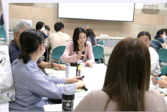
◀◀◀ 第1回 10:00~12:30