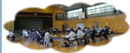
第 1 回校舎改築検討懇談会の様子