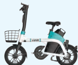
▲電動アシスト自転車/Luup