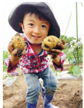
▲昨年度の農業委員会会長賞作品

☎「杉並の農風景」に係る写真 ▶ 大きさ = 六ツ切(A4サイズの印画紙に印刷した写真でも可) ▶ 賞 = 農業委員会会長賞1名(賞状、区内共通商品券5000円分)、入選5名(区内共通商品券2000円分)、佳作10名(区内共通商品券1000円分) ▶ 入賞者発表 = 11月上旬(予定) ☎区内在住・在勤・在学の個人または団体 ☎作品の裏面に住所・氏名・電話番号・タイトルを書いて、10月7日までに杉並区農業委員会(〒167-0043上荻1-2-1Daiwa荻窪タワー2階産業振興センター都市農業係内)へ郵送・持参 ☎同係 ☎5347-9136 ☎1人2点まで。個人を特定できる場合は、事前に写っている人の承諾が必要。入賞作品はデータ等の提出をお願いするなど、杉並の農業振興に関するイベント等に利用する場合あり