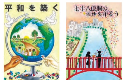
▲昨年度の金賞作品の一部

内「あなたが思う戦争のない平和な世界」や「平和の大切さ・戦争の悲惨さ」などを表す作品(1人1点。自作・未発表のもの) ▶大きさはA3判～四つ切り(393mm×545mm) 区内在住・在学の小学4年生～中学生 区内在学生=各学校へ提出▶区外在学生=作品の裏面右下に学校名・学年・氏名(フリガナ)、作品に込めた思い(一言)を書いて、区民生活部管理課平和事業担当(区役所西棟7階)へ郵送・持参/申込締め切り日=9月9日 区同担当 応募者全員に参加賞あり。入賞作品の著作権は区に帰属し、学校名・学年・氏名を公表の上、展示会やカレンダー作成などの平和推進事業に使用。応募作品は12月中旬に返却(入賞作品は年度末に返却)。入賞者には10月上旬に通知。