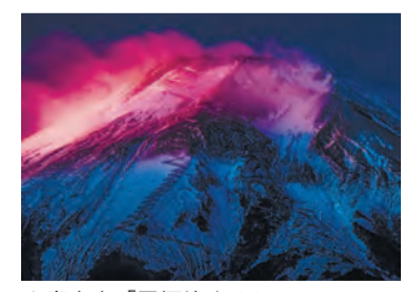
▲富士山「雪煙染まる」