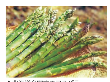
▲北海道名寄市のアスパラ