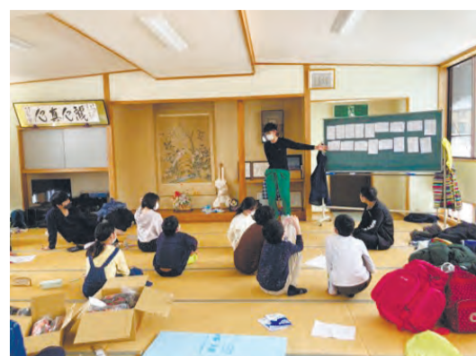
▲わぐわぐ寺子屋プロジェクト (3年度実施)