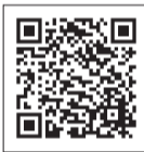
▲口座振替の申し込みについて

6月15日までに申し込んだ場合は、第1期分からの引き落としとなります。口座名義人ご本人がサービス対象の金融機関（みずほ・三菱UFJ・三井住友・りそな・ゆうちょ銀行、西武信用金庫）のキャッシュカードを受付窓口（納税課・区民課〈第1・3・5土曜日のみ〉・区民事務所）に持参すれば、口座振替の申し込みができます。金融機関届出印は不要です。