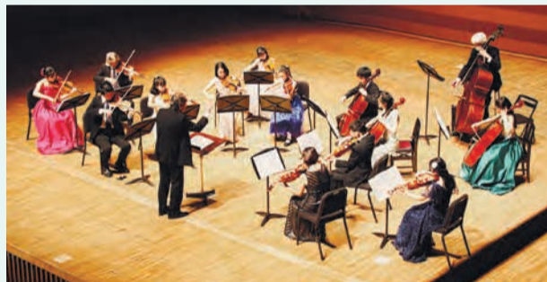
▲荻窪ユース・アンサンブル