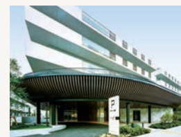
▲フェニックス杉並

天沼3丁目に区内最大級の特別養護老人ホーム「フェニックス杉並」（定員180名）が開設されたことにより、「平成24年度からの10年間で1000床増床」の整備目標を達成しました。