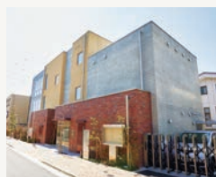
▲コミュニティふらっと永福

子どもから高齢者までの多世代が集い交流する新たな地域コミュニティ施設「コミュニティふらっと」（阿佐谷、東原、馬橋）を開設しました。また、4月には、永福図書館と複合化した「コミュニティふらっと永福」を開設し、複合施設のメリットを生かした運営を進めています。