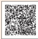
▲東京共同電子申請・届出サービス