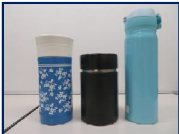
マイボトルを使いましょう