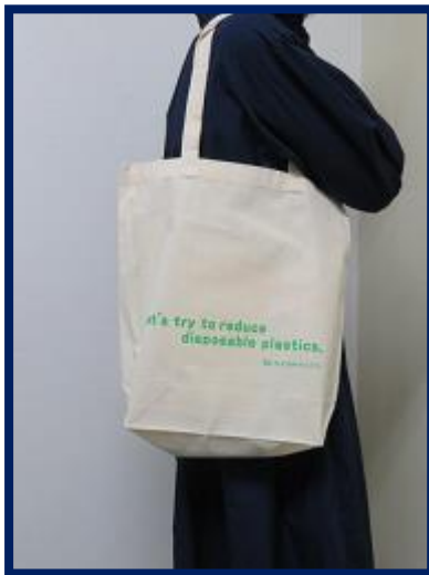
マイバッグを使いましょう