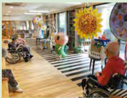
▲ハリボテを見て楽しむ入居者の皆さんの様子