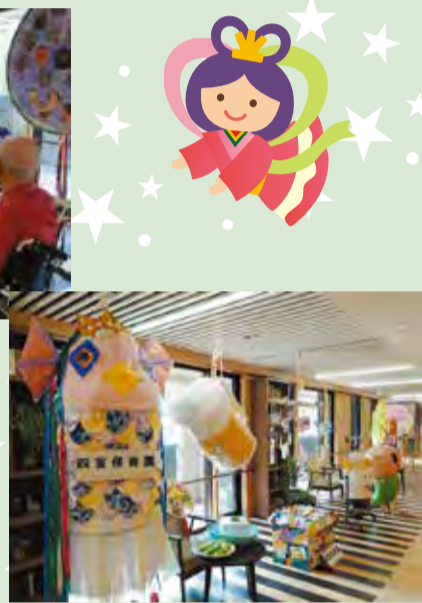
▲エクレシア南伊豆の建物内に設置したハリボテ