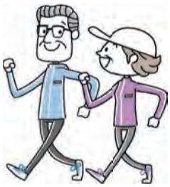
…… いずれも ……

◆「ウォーキング講座」歩いて延ばそう健康寿命 シニア 日 10月5日(月)・12日(月)・19日(月)午前10時～正午(全3回要出席) 場 高井戸保健センター(高井戸東3-20-3) 師 NPO法人杉並さわやかウォーキング 対 区内在住の65歳以上で日常生活に介助の必要がない方 定 15名(抽選) 申 はがき(10面記入例)で、9月10日(必着)までに同センター 他 筆記用具・飲み物・お持ちの方は「はつらつ手帳」持参。ウォーキング記録ノートを差し上げます。長寿応援対象事業